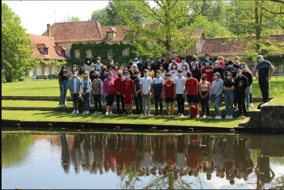
Les élèves du collège de Bü au Domaine des Oseraies – Juin 2021