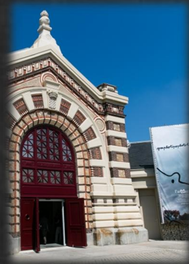
L'AR(T)SENAL ART CONTEMPORAIN DREUX

musee.beaux-arts@agglo-ville.chartres.fr