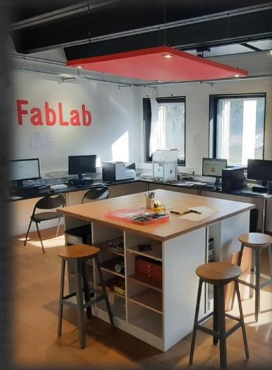
MICRO FOLIE DREUX