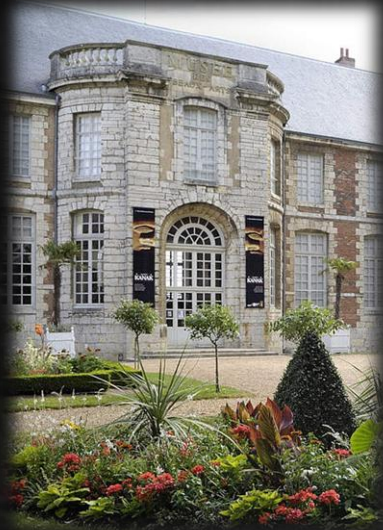
MUSEE DES BEAUX-ARTS CHARTRES