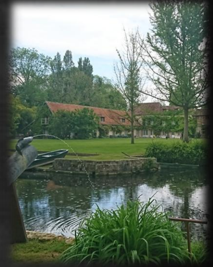
DOMAINE DES OSERAIES ART CONTEMPORAIN FAVEROLLES