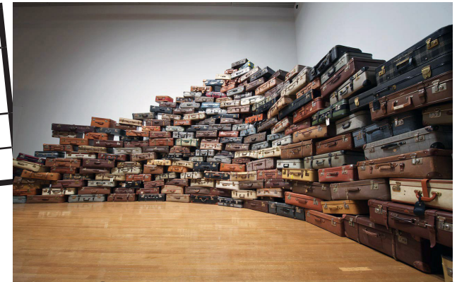
Chiharu Shiota, Accumulation – Searching for the Destination, Marugame Genichiro-Inokuma Museum of Contemporary Art, Kagawa

Quelle est l'objet que l'artiste a accumulé ?