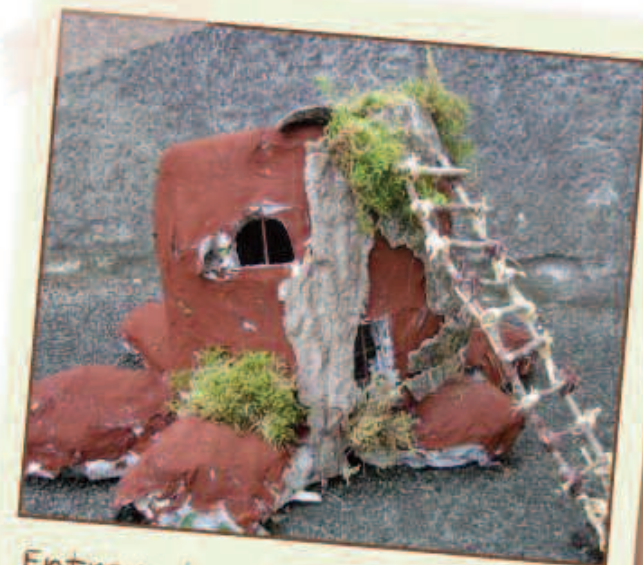
Entre nature et architecture

au vernissage de l'exposition de l'espace culturel rural de la Brenne