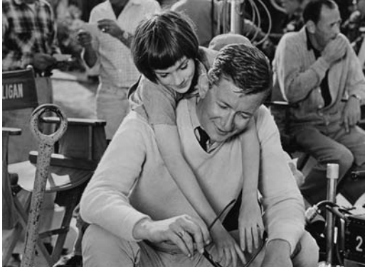
Robert Mulligan et Mary Badham (tournage).